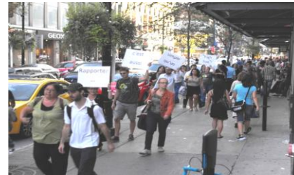
Lieu : Rue Sainte-Catherine, entre les rues Union et McGill Date : 8 septembre 2011